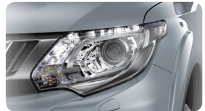
LED Dnevna svetla